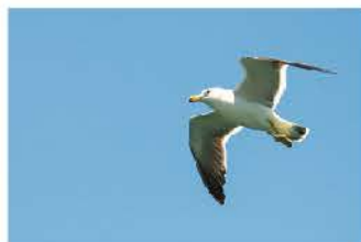
船上で海鳥の餌やりができます