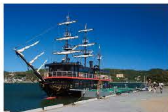
黒船サスケハナ号を模した遊覧船

電話 / 0558-22-1151 料金 / 1,500円 時間 / 9:10~15:30 (1日1便) 定休日 / 無休 住所 / 下田市外ヶ岡 19