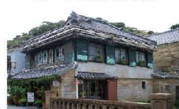
風情のある古民家カフェ・草画房