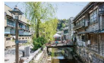
ペリーロード沿いに流れる平滑川