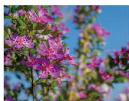
秋に咲くリトルエンジェル

下田駅前にある下田ロープウェイで寝姿山へ。山頂の寝姿山自然公園は花公園となっていて、四季折々の花が楽しめます。また、展望台からは下田湾の絶景をご覧いただけます。