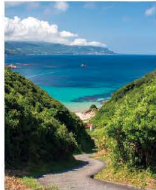
坂の下に広がるビーチ

下田の中では穴場的な存在で、波も穏やかなプライベート感覚いっぱいのミニ海水浴場。須崎御用邸に隣接しており、豊かな自然に囲まれています。客層は家族連れが多く、小さな子供がいても目が届くので安心。岩場で磯遊びも楽しめます。