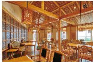
ザ・ロイヤルエクスプレスと同コンセプトの、下田湾・伊豆の島々を見渡す展望レストラン、ザ・ロイヤルハウス