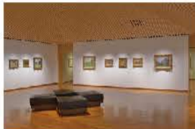
近代絵画が並ぶ館内

近代絵画と仏教美術のジャンルを超えた美が出あう美術館。印象派やマティス、ピカソ、安井曾太郎、須田国太郎、小林古径などを中心とした絵画、平安・鎌倉時代の仏像、奈良時代の古写経、近現代の仏像まで幅広い美術品を収蔵しています。