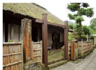
石畳の小径沿いにある吉田松陰寓寄処