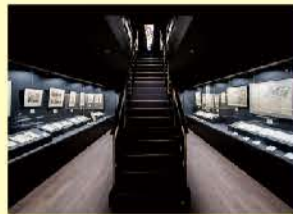
貴重な黒船関連資料を展示

ミュージアムのテーマは「日本人が見た外国、外国人が見た日本」。外国人と日本人がお互いをどれだけ理解していたのか、わかりやすい展示です。教科書やテレビで見る絵もたくさん。