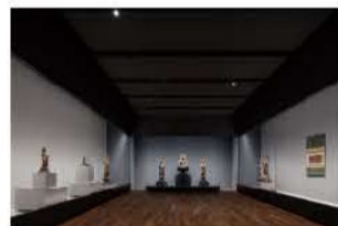
仏像が並ぶ展示室

DATA 電話 / 0558-28-1228 料金 / 大人 1,000円、学生 500円、高校生以下無料 ※団体10名以上10%割引 時間 / 9:30~16:30(入館 16:00 まで) 定休日 / 展覧会会期中は無休、展示替え日のみ休館 住所 / 下田市宇土金 341