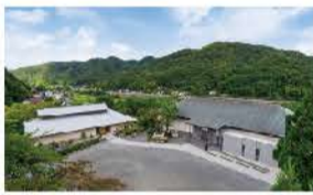
山あいにたたずむ美術館