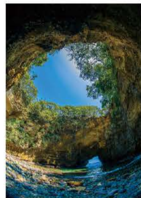
見上げると天窓が広がる

直径約50mの天然の洞窟。道路沿いの入口から洞窟を通って天窓の下に立つことができ、上から光が差し込む様子は幻想的です。洞窟は上からも覗き込むことができ、波の侵食によってハートの形に見えることからハートのラブスポットとして人気です。