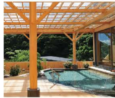
森林浴できる露天風呂

下田の奥座敷、稲穂地区にある自家源泉かけ流しの秘湯「観音温泉」。源泉より滾々と湧き出るpH9.5、超軟水、トロトロの肌触りの美肌の湯を源泉かけ流し100%を堪能ください。