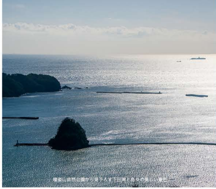
摩多山自然公園から見た下田湾と島々の美しい景色

「美しさ、煌めく旅。」をコンセプトとした観光列車で、木の温もりを感じる車内では監修シェフこだわりのお食事やヴァイオリンの生演奏などをお楽しみいただけます。人気のクルーズトレイン「なつ星 in 九州」と同じく、水戸岡鋭治氏がデザインした至高の空間で贅沢な時間をお過ごしいただけます。