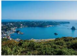
寝姿山から見える下田湾

DATA 電話 / 0558-22-1211 料金 / 往復 1,500円(小人 750円) 時間 / 8:45~16:45(季節変動あり) ※上り最終は 16:15 発 定休日 / 無し ※天候による運休あり 住所 / 下田市東本郷 1 丁目 3-2 ※レストランは水曜定休、営業時間は要問合せ