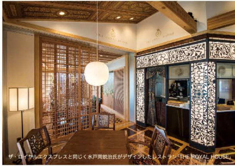
ザ・ロイヤルエクスプレスと同じく水戸岡鋭治氏がデザインしたレストラン「THE ROYAL HOUSE」

2017年に「ザ・ロイヤルエクスプレス」、2020年には「サフィール踊り子」がお目見えし、下田までの電車の旅を優雅に演出してくれています。電車に乗った瞬間から旅のはじまり。目的地の下田では、ゆったりと過ごすのが贅沢な時間の使い方。海辺を歩いたり、ゆっくり温泉につかったり、いつもより時間をかけて食事を楽しんだり…。心と体を癒す特別な時をお過ごしください。