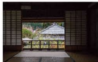
松陰先生が居住していた2階の部屋