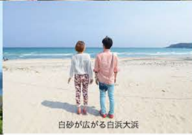
白砂が広がる白浜大浜