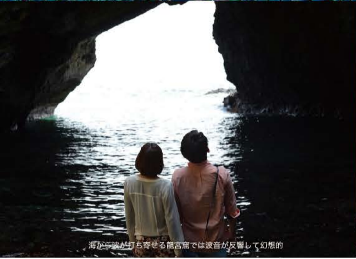
海が波が打ち寄せる龍宮窟では波音が反響して幻想的