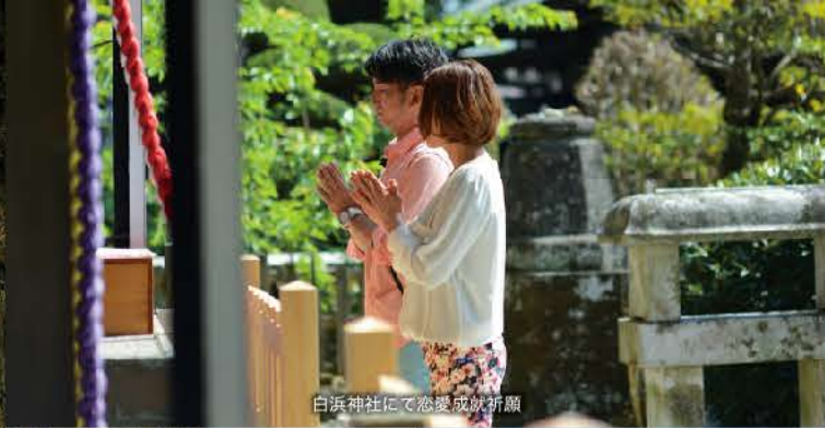
白浜神社にて恋愛成就祈願