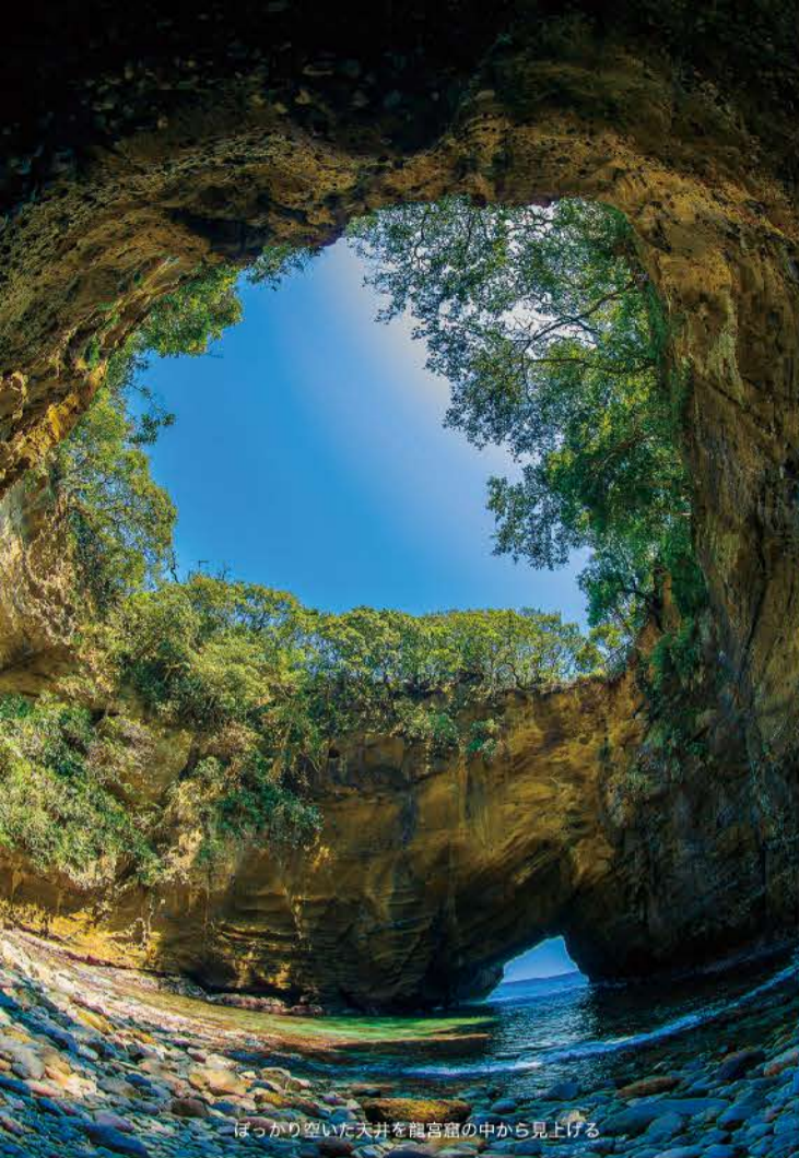
ぼっかり空いた天井を龍宮窟の中から見上げる