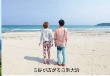
白砂が広がる白浜大浜