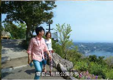
寝姿山自然公園を歩く