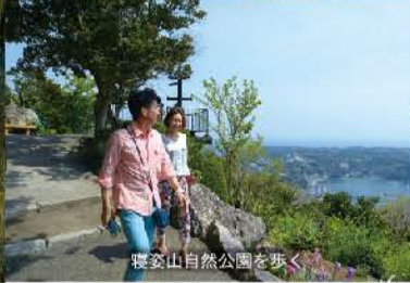
寝覚山自然公園を歩く