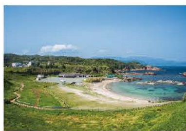
灯台のある爪木崎

傾斜 30 度の砂の山。龍宮窟のすぐ隣にあるので、二人でサンドスキーをしてみたら、スリルを二人で楽しめばお互いの距離も縮むはず!