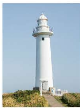
正面から見た爪木埼灯台