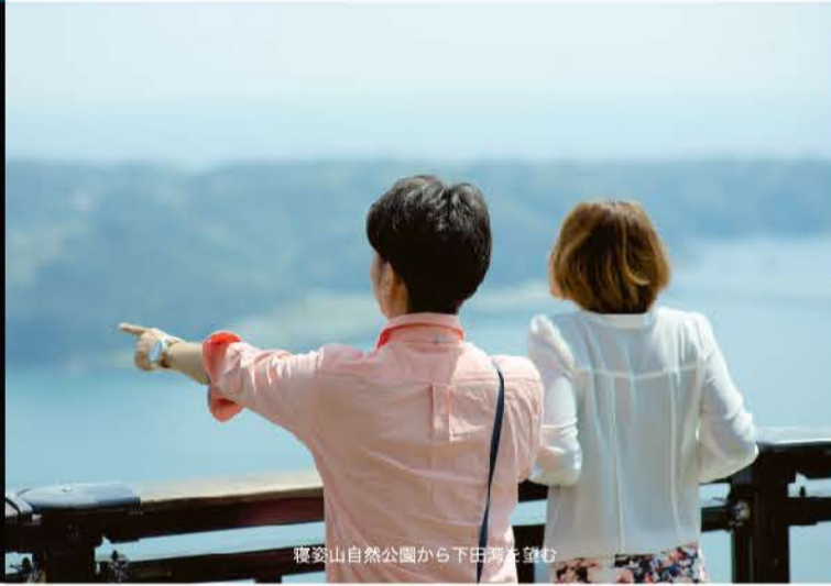
寝姿山自然公園から下田海を望む

エメラルドグリーンの海と遥か地平線までつづく青い空。下田はカップルのデートにぴったりの観光地です。二人の愛を育む事のできるスポットが多くあるのがその理由。龍宮窟はラブパワースポットとしても人気で、ぜひ訪れて欲しい場所の一つ。二人の愛を確かめたい、二人の絆を深めたい、二人の愛に感謝したい、そんなカップルにぴったりのスポットです。