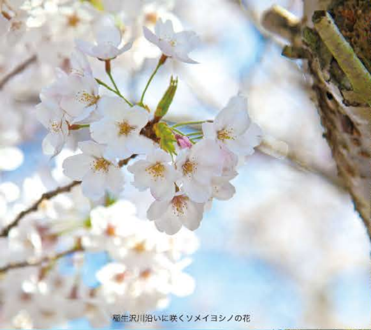
稲生沢川沿いに咲くソメイヨシノの花