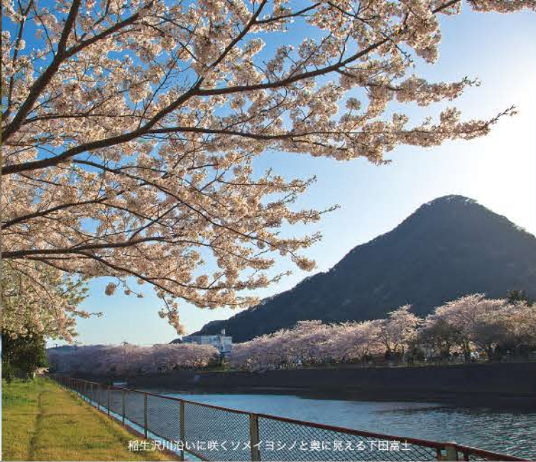
稲生沢川沿いに咲くソメイヨシノと奥に見える下田富士