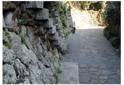
石畳が続く湯の華小路