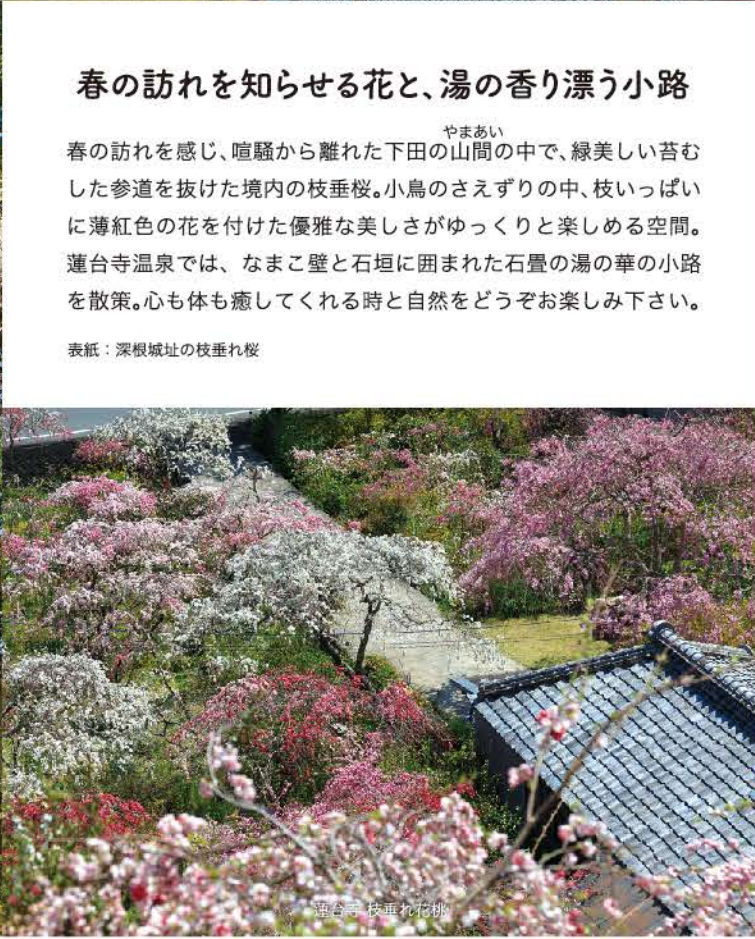
蓮台寺 枝垂れ花桃