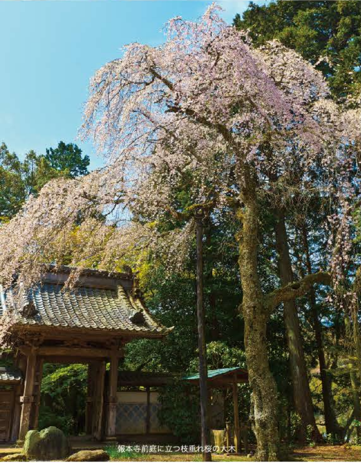
報本寺前庭に立つ枝垂れ桜の大木