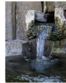
小径の各所にある手湯