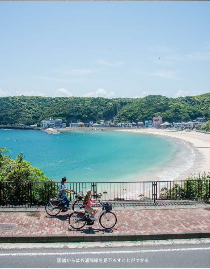
国道からは外浦海岸を見下ろすことができる