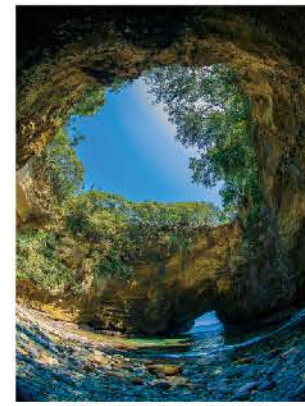
自然が造り出した大きな天窓

直径約50mの天窓が開く神秘的な洞窟です。道路沿いの入口から階段を下りて、天窓の中に入ることができます。洞窟内に光が差し込む様子は幻想的。洞窟は上からも覗き込むことができ、波の侵食によってハートの形に見えることからハートのラブパワースポットとして人気です。 ※見下す際、落下しないようご注意ください ※遊歩道は足下に十分ご注意ください