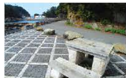
のんびりできるベンチスペース

海岸に沿って舗装された遊歩道は、海の間際を走ることができるコースです。途中、吊り橋やベンチがあり、コースの最後は下田海中水族館となります。そちらを折り返すか、そのまま街中へ繰り出し、ペリーロードなど開国の歴史散策も楽しめます。