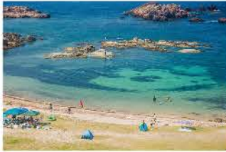
透明度が高く、磯遊びができる海岸