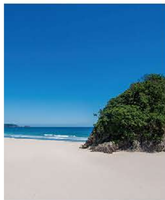
名前の通り、広々としたビーチ

長さ770mもの雄大な浜、整った環境でサーファーや家族連れに人気のビーチです。国道から離れているため、静かに読書にふけるなど優雅な一時を過ごせます。周辺にはオシャレなカフェがあるのも特徴。近年は口コミで外国人観光客も季節を問わず多く訪れています。自転車で界隈を巡るのもオススメです。