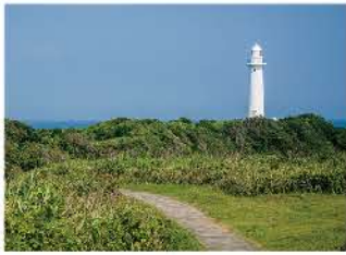
岬の先端に建つ白亜の灯台

白亜の灯台が建つ半島の突端。湾の岩場で海の生物を観察したり、芝生の広場・グリーンエリアへと続く遊歩道を散策したりと一日遊べます。付近には花園(入場無料)もあります。