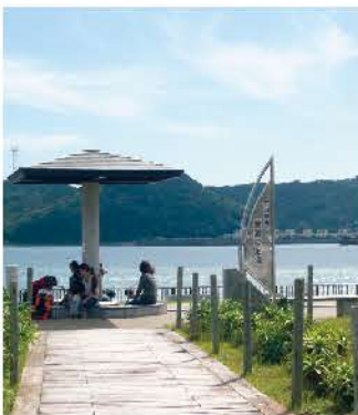
広々とした芝生広場