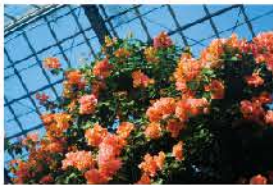
熱帯植物が見られる花園