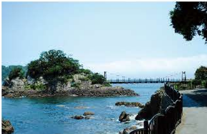
吊り橋が絵になる風景のコース