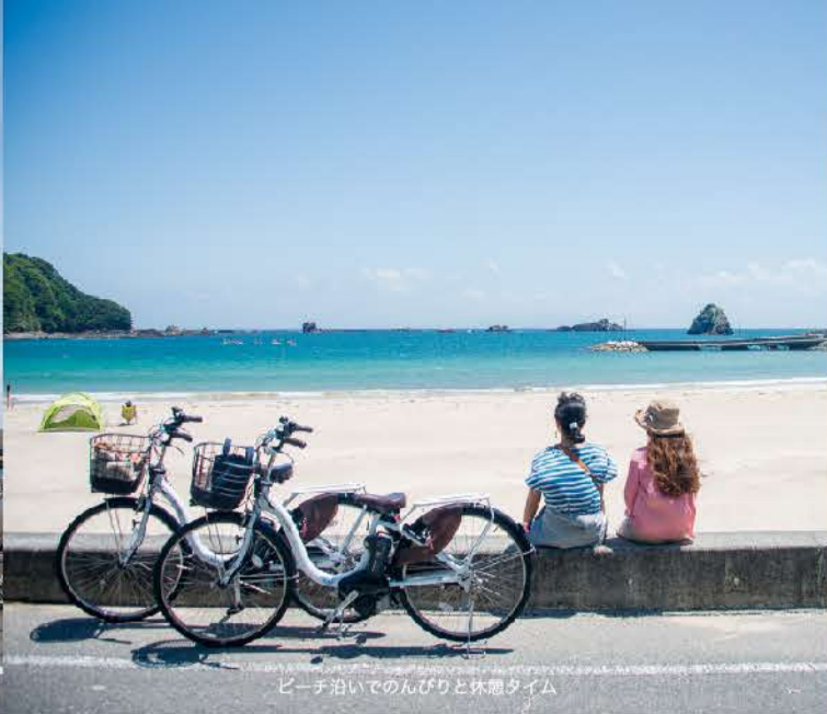
ビーチ沿いでのおんびりと休憩タイム