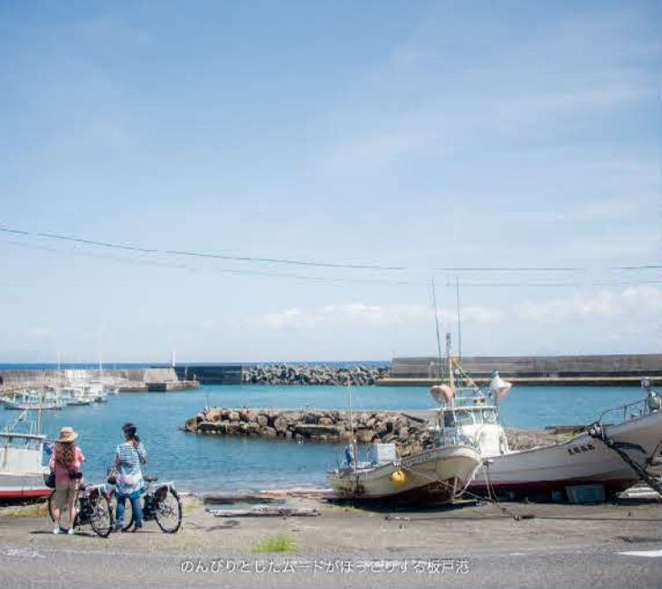
のんびりとしたムードがほろほろする坂戸港