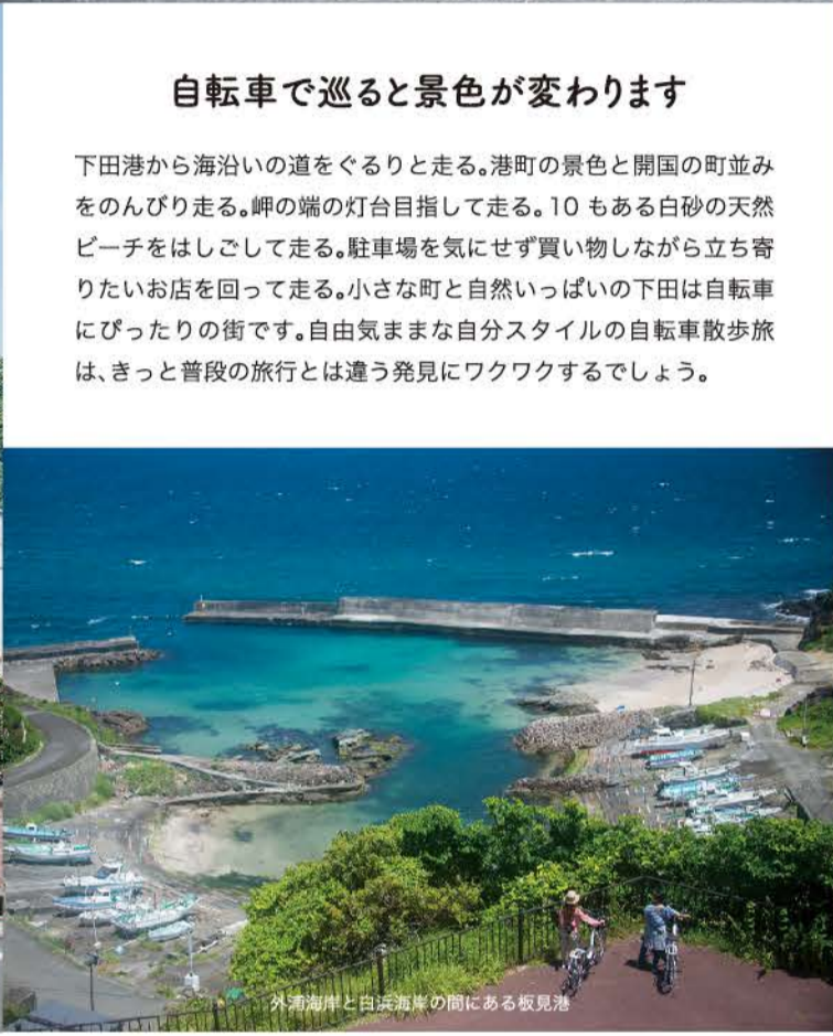
外浦海岸と白浜海岸の間にある板見港