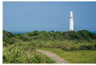
岬の先端に建つ白亜の灯台