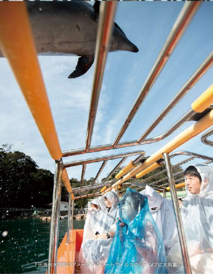
下田海中水族館のイメージシートでイルカのジャンプに大興奮

お子さんとの最高の思い出を下田で! 時間も体力も限られる乳幼児との旅行。砂浜で山やお城を作ったり、パパやママとの〜んびり散歩。遊覧船に乗って船乗り気分! 最後は下田の楽しかった思い出に、手形を焼いてもらうのもオススメ。お子様との旅行を下田でお楽しみください。 表紙写真: まどが浜海遊公園の河津桜と子どもたち