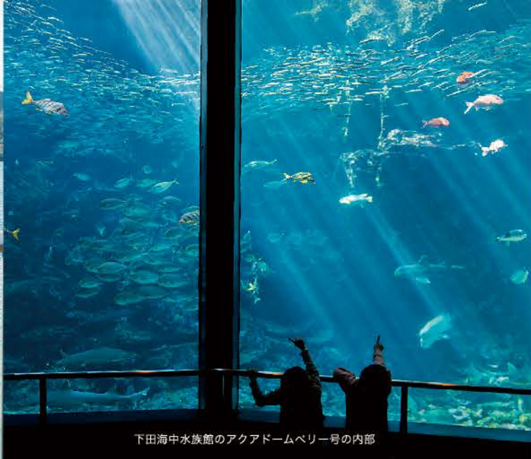
下田海中水族館のアクアドームペリー号の内部