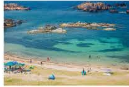
透明度が高く、磯遊びができる海岸