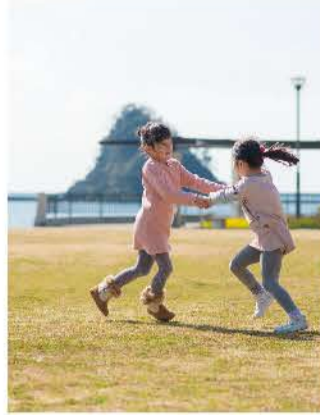
広々とした芝生広場