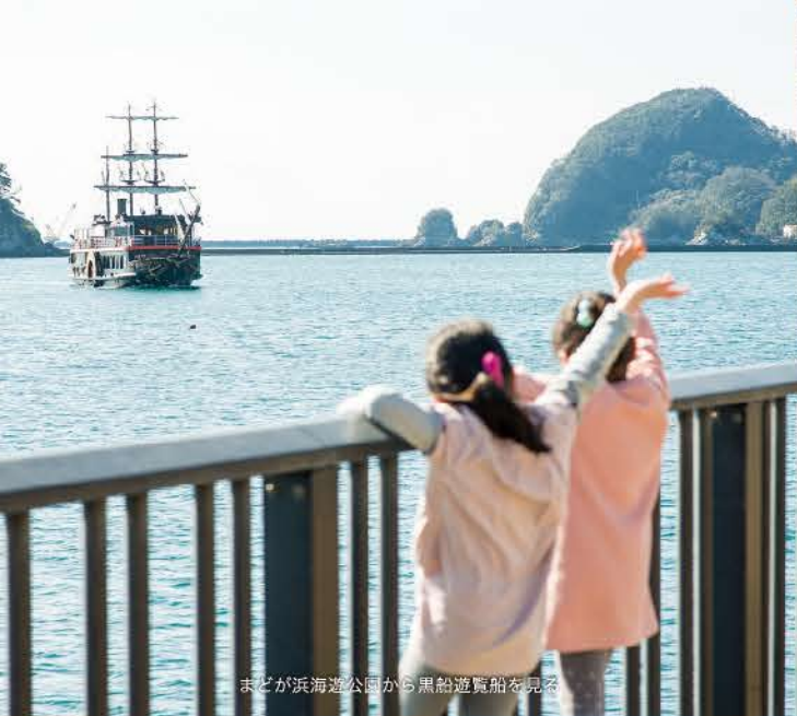
まどが浜海遊公園から黒船遊覧船を見る