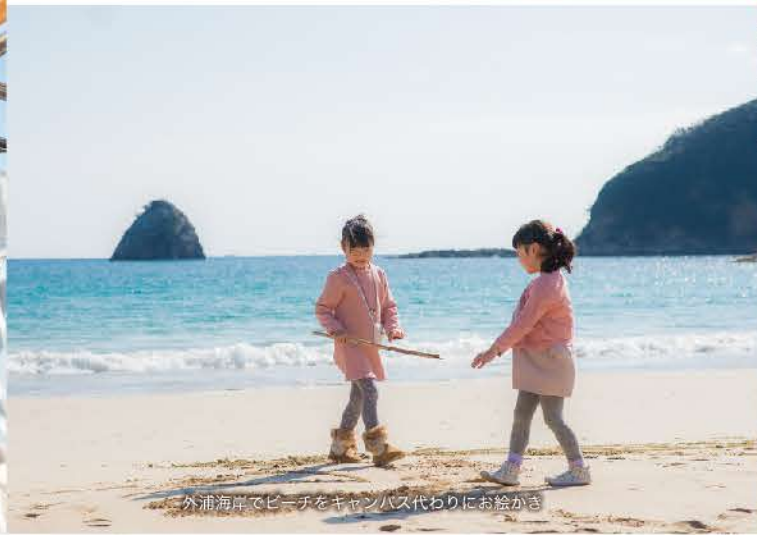
外浦海岸でビーチをキャンパス代わりにお絵かき

お子さんとの最高の思い出を下田で! 時間も体力も限られる乳幼児との旅行。砂浜で山やお城を作ったり、パパやママとの〜んびり散歩。遊覧船に乗って船乗り気分! 最後は下田の楽しかった思い出に、手形を焼いてもらうのもオススメ。お子様との旅行を下田でお楽しみください。 表紙写真: まどが浜海遊公園の河津桜と子どもたち