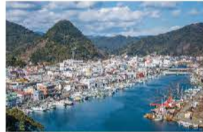
園内から見下ろす街の眺望