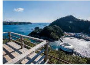
志太ヶ浦展望台からの眺望