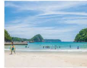
目が行き届く小さなビーチ