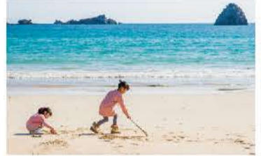
オフシーズンの天気の良い日にはお弁当を持ってのんびり過ごせるのが嬉しい