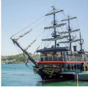
黒い船体に赤いラインが特徴

ベリール艦隊の旗艦サスケハナ号をモチーフにした遊覧船で下田湾をクルージング。1周約20分で歴史の解説付きで下田を案内してくれます。真っ黒なお船で元気にGO!!