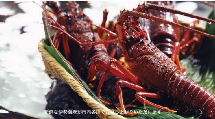
新鮮な伊勢海老が市内各所でお楽しみいただけます

伊豆の秋の美味といえば伊勢海老です！ 毎年、伊豆各地では9月中旬から伊勢海老が解禁となり、下田でもこの時期に獲れたての新鮮な伊勢海老をご賞味いただけます。輸入エビの多い中、本当の「伊勢海老」と呼べるのは、日本の磯でとれたものだけです。味も格段に美味。下田でとれた伊勢海老を下田の各宿泊施設で食べられるというのだから、これは贅沢というものです。下田市観光協会加盟の宿泊施設からも期間限定で伊勢海老の特別限定プランをご用意しています。食の秋におすすしたい伊勢海老プランの数々！ お刺身・鬼殻焼き・味噌汁など丸々一匹、宿によってバラエティに富んだ贅沢なメニューをお楽しみ下さい。