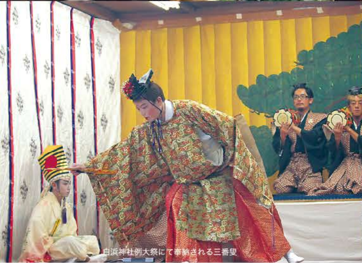
白浜神社例大祭にて奉納される三番叟