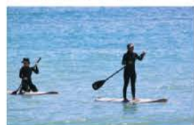
スタンドアップパドル(SUP)