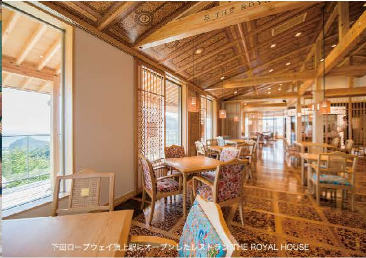
下田ロープウェイ頂上駅にオープンしたレストラン THE ROYAL HOUSE