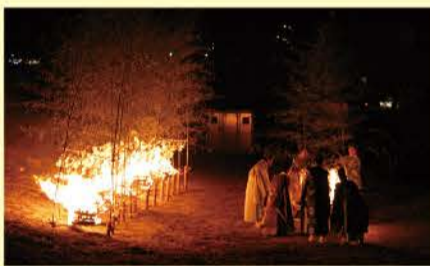
28日の夜に奉納される火達祭

2400年以上の歴史があり、伊豆で最古の宮として由緒ある白浜神社。毎年10月28日から30日までの3日間で行われる例大祭では、伊豆諸島の神々に祭りの始まりを知らせる火達祭、下田市無形文化財に指定されている三番叟の演舞、神々に祭が無事終了したことを知らせる御幣流しが行われる古式ゆかしき伝統行事です。