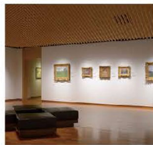
近代絵画が並ぶ展示空間