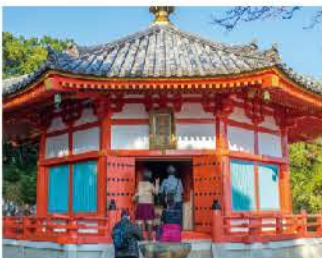
縁結びスポット愛染明王堂