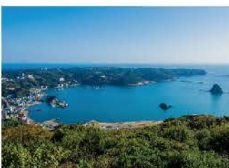
寝姿山から見える下田湾