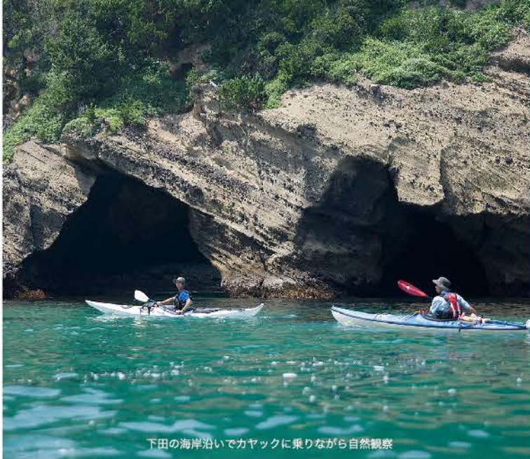
下田の海岸沿いでカヤックに乗りながら自然観察