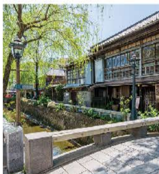
小径には枝垂れ柳が立ち並びます