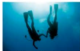
スキューバダイビング