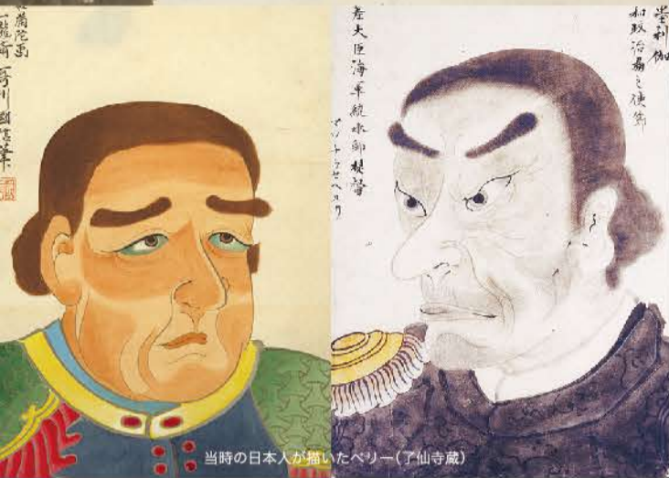
当時の日本人が描いたペリー(了仙寺蔵)