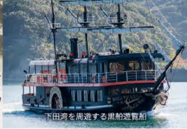
下田湾を周遊する黒船遊覧船