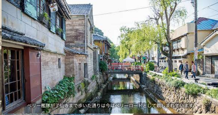
ペリー艦隊が了仙寺まで歩いた通りは今はペリーロードとして親しまれています