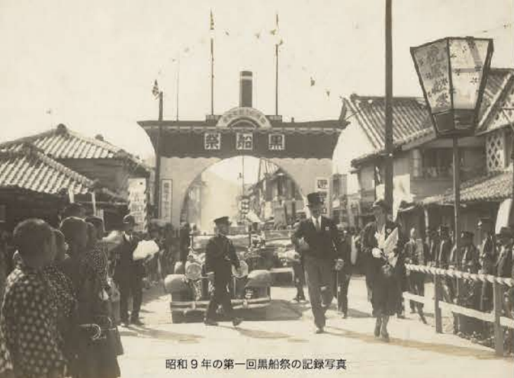
昭和9年の第一回黒船祭の記録写真