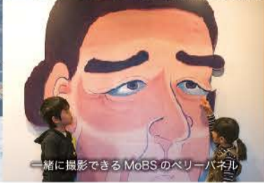
一緒に撮影できるMoBSのペリーパネル