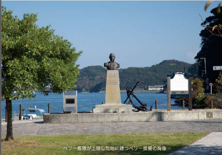
ペリー艦隊が上陸した地に建つペリー提督の胸像