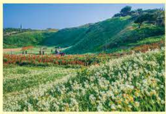
辺り一面に広がる水仙

爪木崎には水仙の群生地があり、最盛期には300万本の水仙が甘い香りを漂わせ、ひと足早い春の訪れを感じることができます。例年12月20日から1月末まで、水仙まつりが開催され賑わいます。