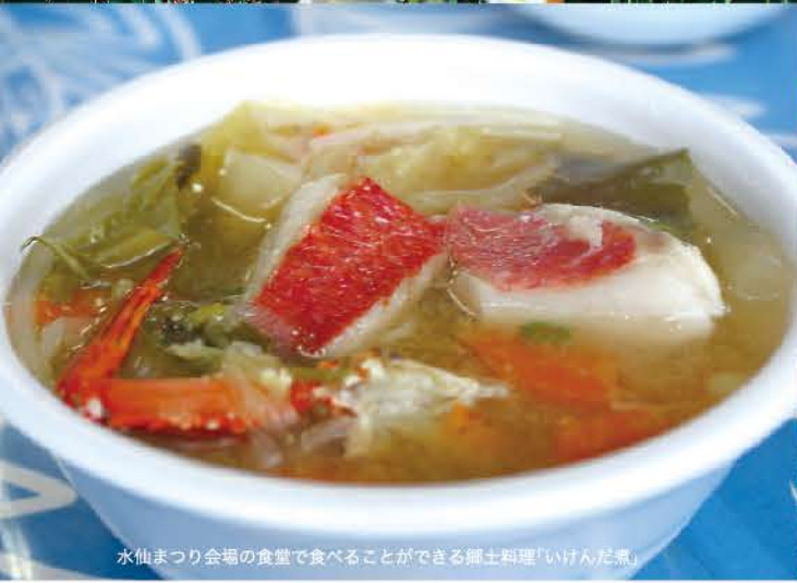
水仙まつり会場の食堂で食べることができる郷土料理「いけんだ煮」