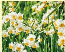
白と黄色が可愛い水仙の花