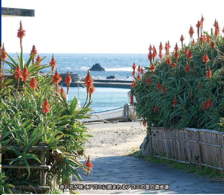
赤い花が咲くアロエに囲まれるアロエの里の遊歩道