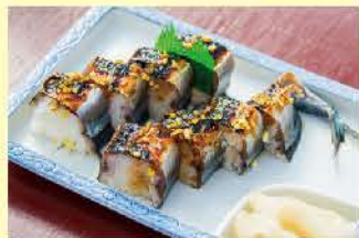
売店で販売される名物のさんま寿司