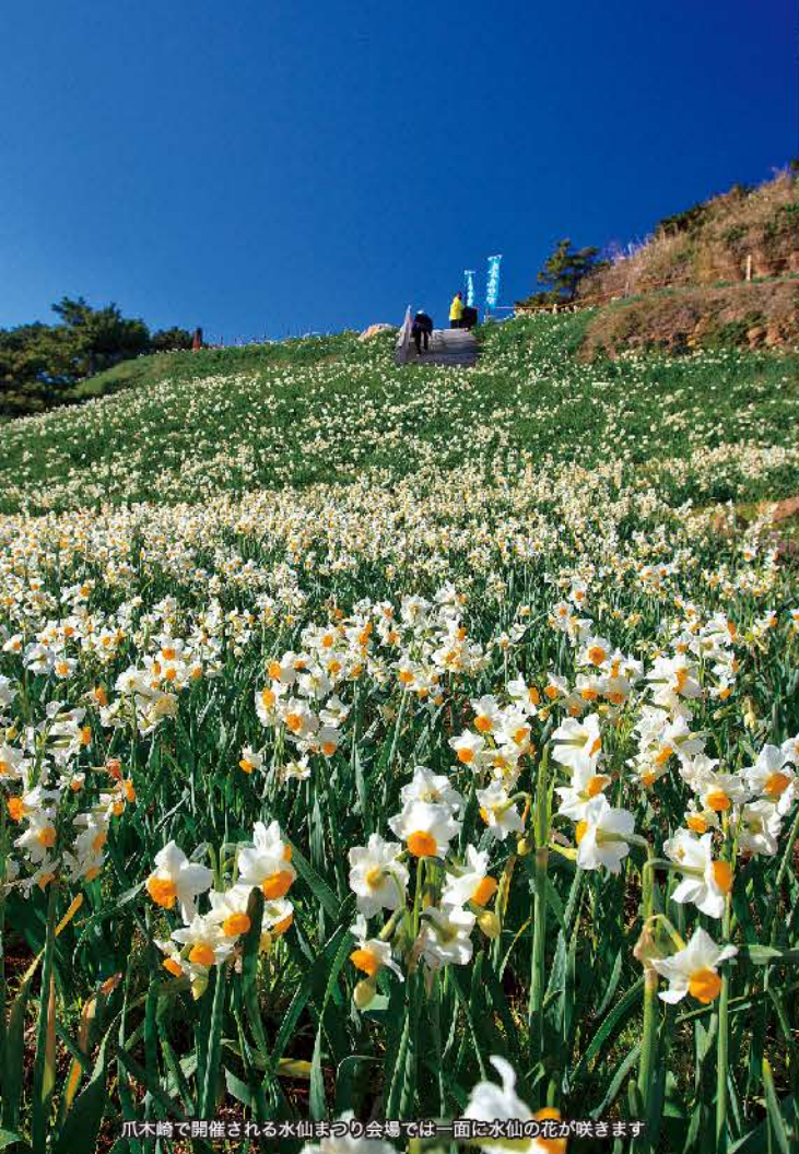
爪木崎で開催される水仙まつり会場では一面に水仙の花が咲きます