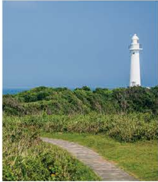
岬の先端に建つ白亜の灯台

白亜の灯台が建つ半島の先端。湾の岩場で海の生物を観察したり、芝生の広場・グリーンエリアへと続く遊歩道を散策したりと一日遊べます。付近には花園(入場無料)もあります。