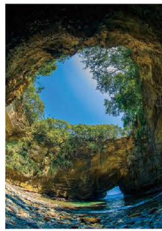
見上げると天窓が広がる

直径約50mの天窓が開く神秘的な洞窟です。道路沿いの入口から洞窟を歩いて天窓の下に立つことができ、上から光が差し込む様子は幻想的です。洞窟は上からも覗き込むことができ、波の侵食によってハートの形に見えることからハートのラブパワースポットとして人気です。