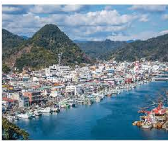
公園から見下ろした下田市街の景色