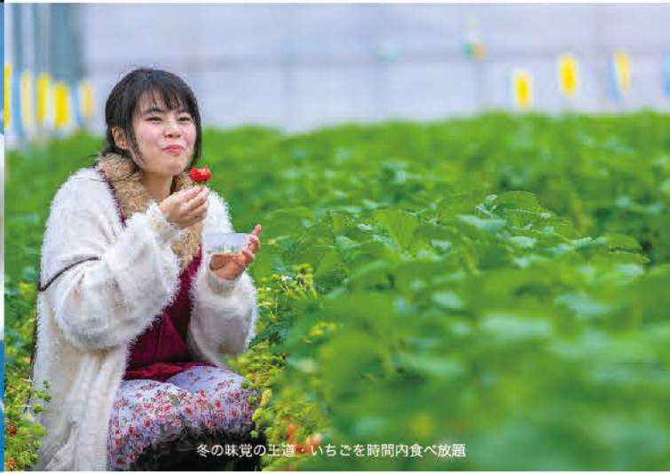
冬の味覚の土産・いちごを時間内食べ放題