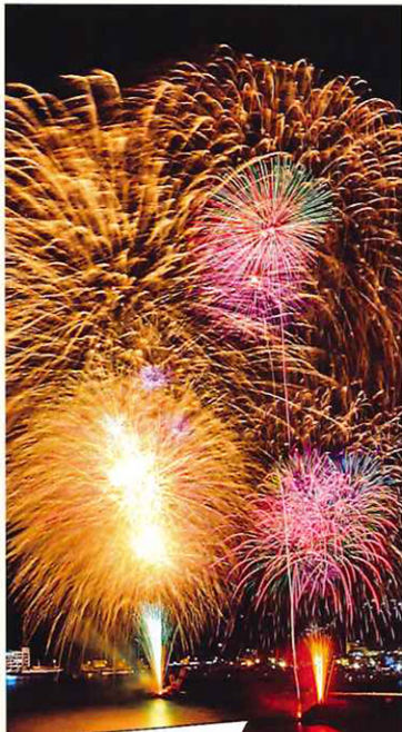
10年ぶり 大迫力の2尺玉!