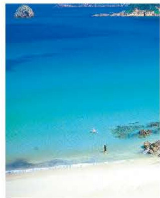
国道から見下ろした外浦海岸

700mもの美しく広大な砂浜をもつ、伊豆最大のビーチ。砂浜が国道に面しており、開放感があります。また、全国的にも大変有名で毎年多くのサーファーや若者で賑わいます。白い砂浜とエメラルドグリーンが織りなすコントラストの美しさは多くの人を魅了します。シーズン前でも海洋浴を楽しむ方が増えています。シーズン以外の時期でもサラサラな白砂が美しいです。広々としたビーチは気持ちの良い開放感です。