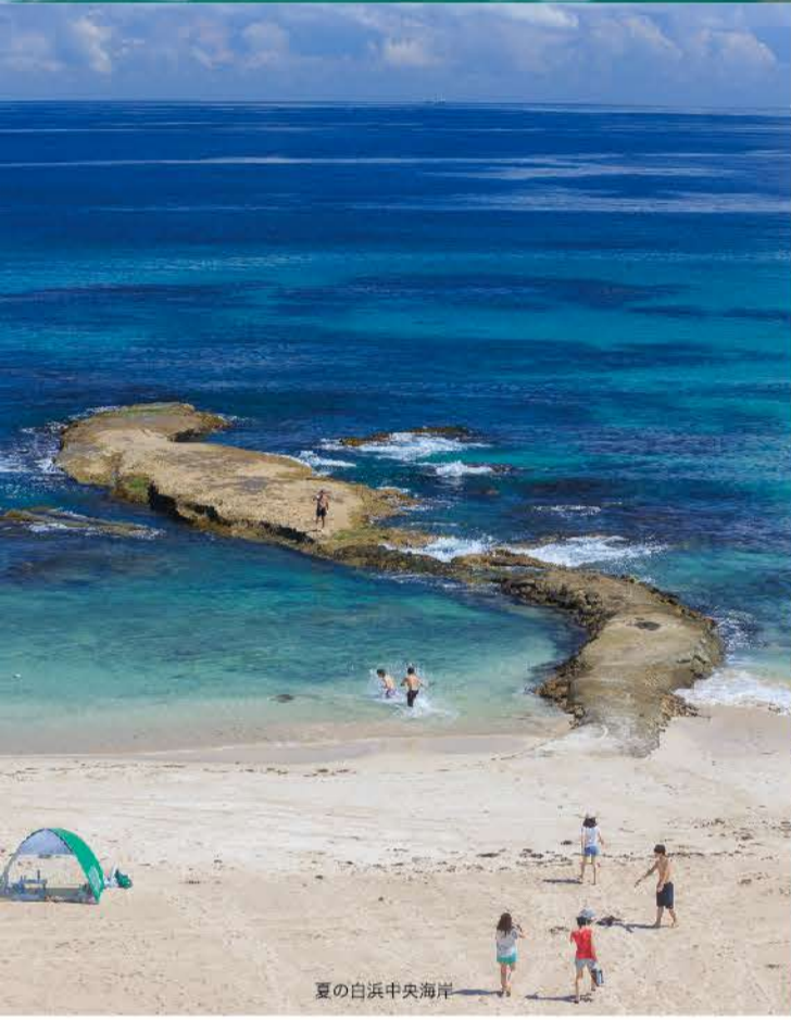
夏の白浜中央海岸