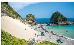
天然の砂山のサンドスキー場