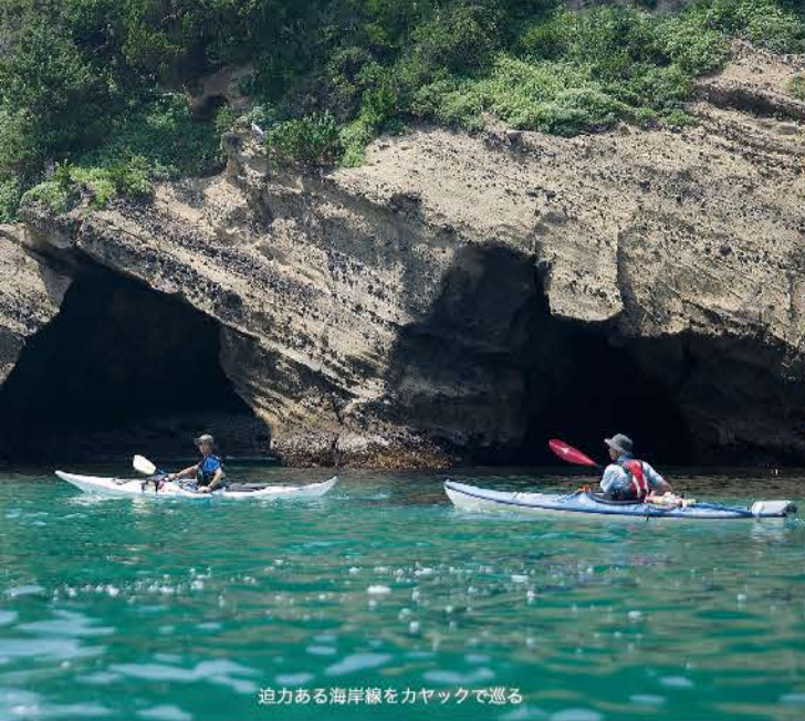
迫力ある海岸線をカヤックで巡る