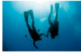
スキューバダイビング