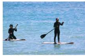
スタンドアップパドル(SUP)