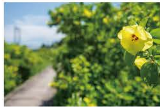
7月にハマボウの花が咲くボードウォーク