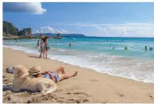
リラックスムードのビーチ

長さ770mもの雄大な浜、整った環境でサーファーや家族連れに大人気のビーチです。国道から離れているため、静かに読書にふけるなど優雅な一時を過ごせます。周辺にはオシャレなカフェがあるのも特徴。近年は口コミで外国人観光客も季節を問わず多く訪れています。すぐ近くにあるボードウォークでは、7月にハマボウの花を楽しむことができます。